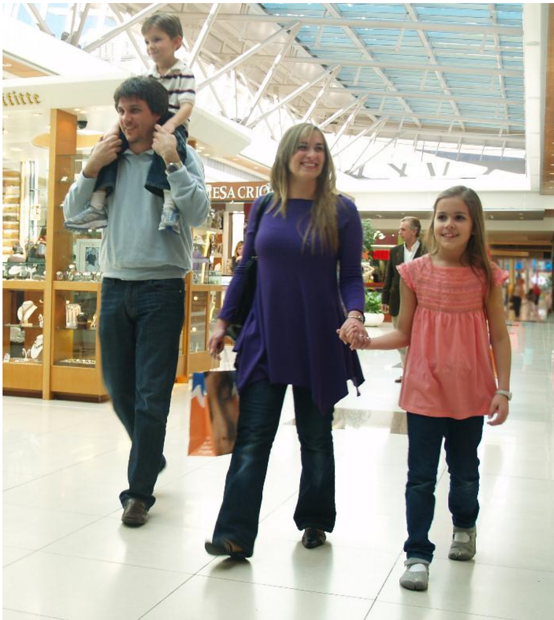
Typická evropská rodina