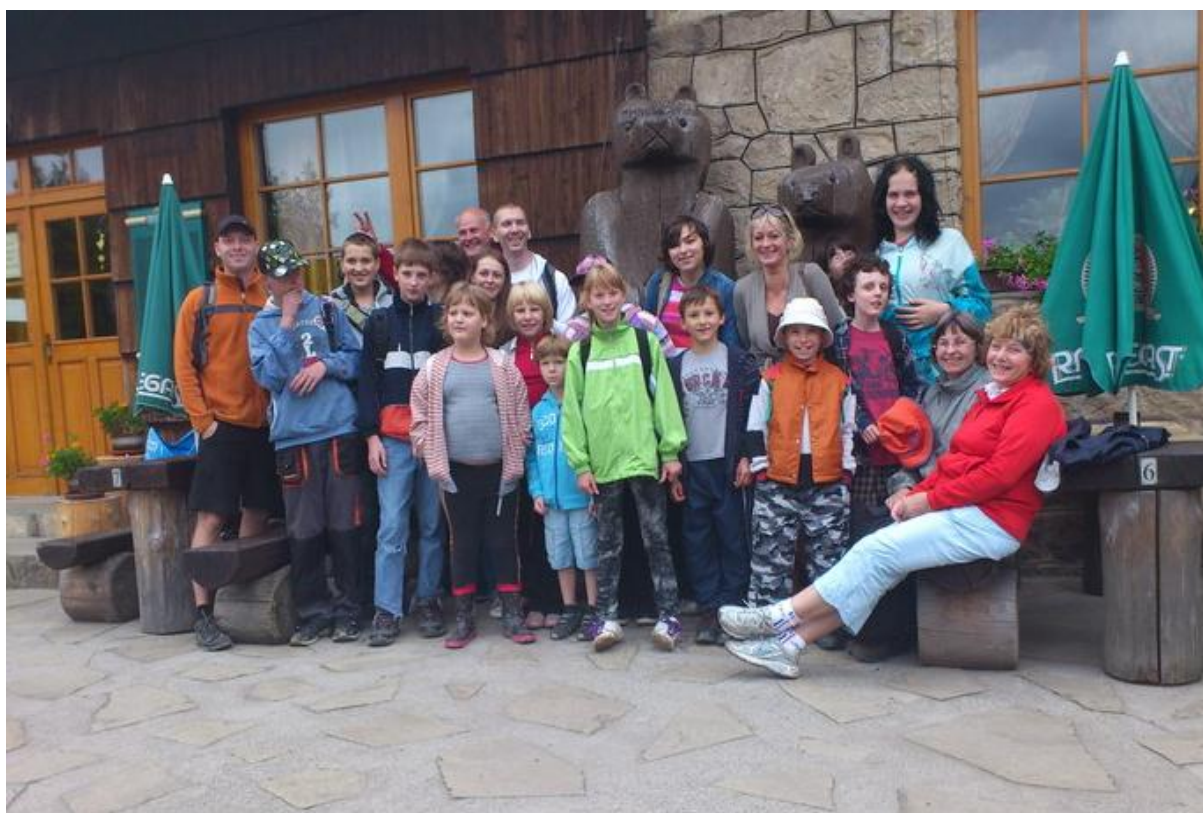
Kamarádi-spolužáci na výletě

Kamarádství je nižší stupeň přátelství. Kamarádi se znají, tykají si, část dne tráví spolu, mají podobné problémy a zážitky. Kamarádství často vzniká ve škole (spolužáci) nebo v zaměstnání. Když se ale kamarád přestěhuje, nebo ukončí školu, vztah většinou skončí.