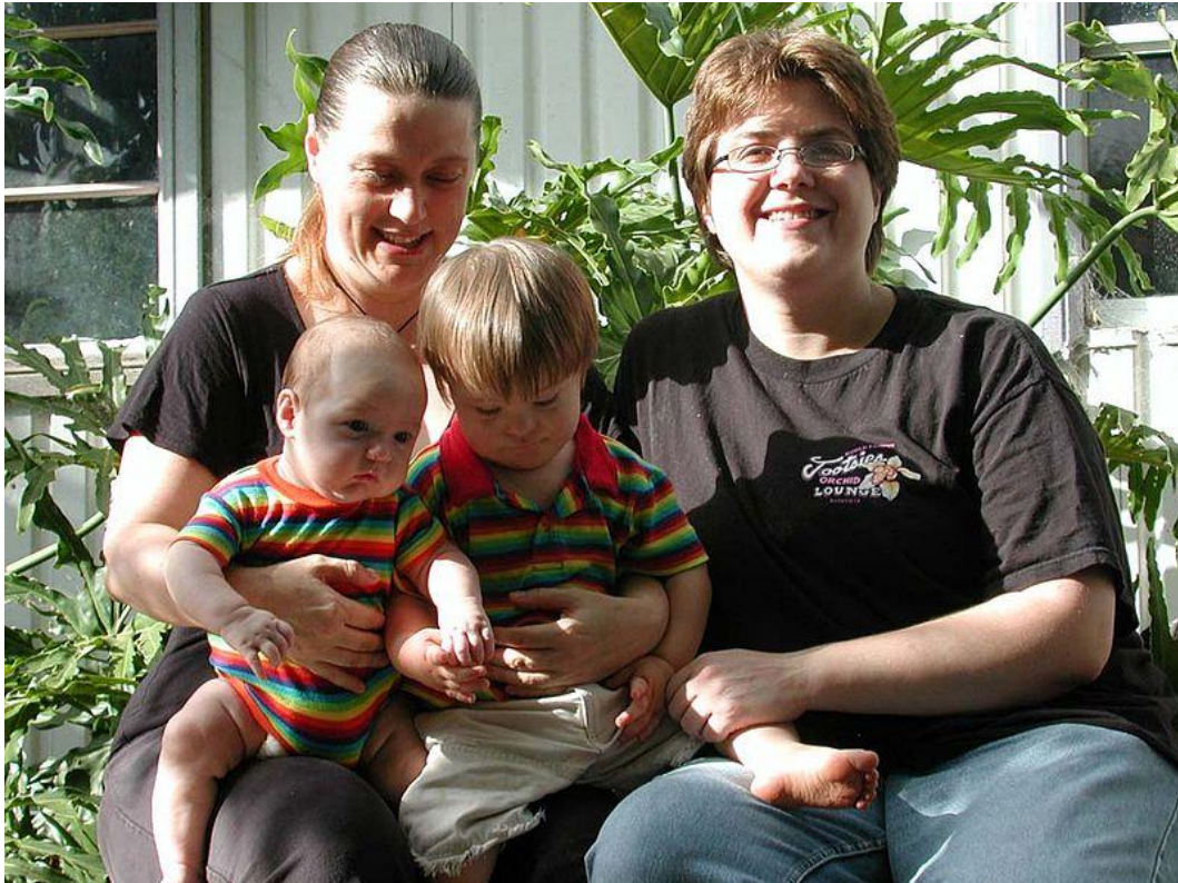
Lesbická rodina s dětmi

Lásku si někdy lidé pletou se ZAMILOVANOSTÍ . Zamilovanost je cit krátkodobý. Může se změnit na lásku. Manželství uzavřené jen ze zamilovanosti, většinou končí rozchodem.