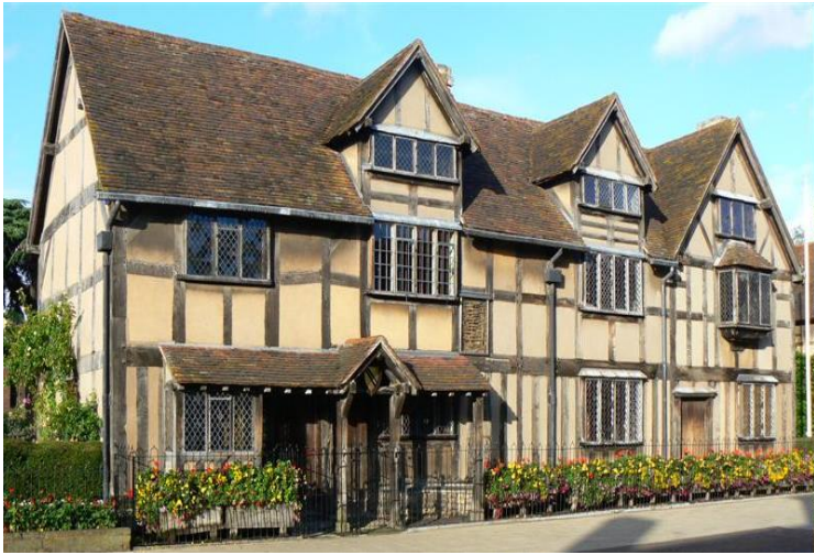
Shakespearův rodný dům