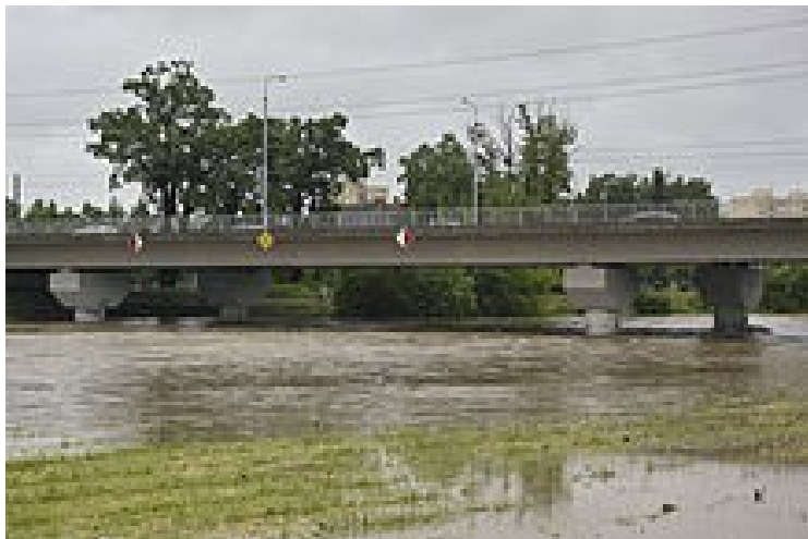
1. Povodeň – most

Po chvíli všichni tři došli až na most přes řeku. Jak se děti podivily! Klidná, říčka se dnes hnala pod mostem jako divá a ještě k tomu v ní bylo asi třikrát více vody!