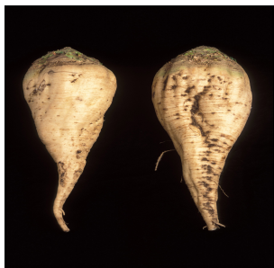
8. Cukrová řepa

„Nene, soused měl letos nasazenu krmnou řepu. Tu potřebuje jako krmivo pro svůj dobytek. Jinak na velkých družstevních polích se sází řepa cukrová. Z té se vyrábí cukr anebo třeba líh.