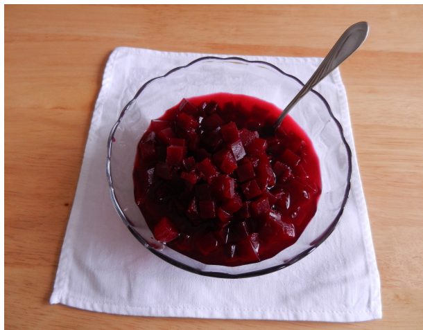
12. Zavařená červená řepa

A když se podíváte tamhle na východ, tam na to holé pole, tak tam rostla pšenice. Ta se však už v létě sklídila.