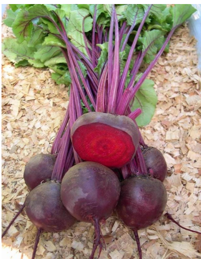
11. Červená řepa

A pak ještě existuje jeden druh řepy, a tu dobře znáš. Tu a tam ji míváš k obědu jako přílohu k bramborům a masu.“ Tu opravdu Pavlík znal. Zavařená červená řepa mu opravdu chutnala a navíc se o ní říká, že je i zdravá.