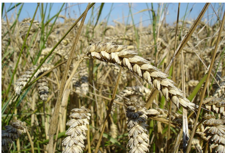
13. Pšenice na poli

Víte, co se dělá z pšenice?“ „Mouka a z té pak pečivo!“ volal Pavlík. Tohle už mu maminka vysvětlovala.