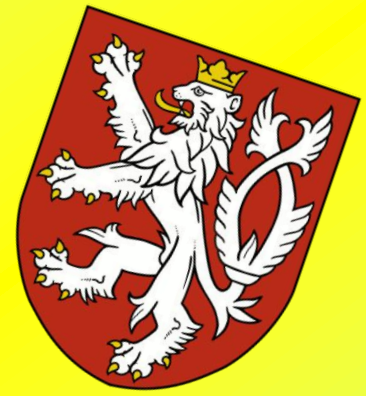
moderní verze historického znaku Čech