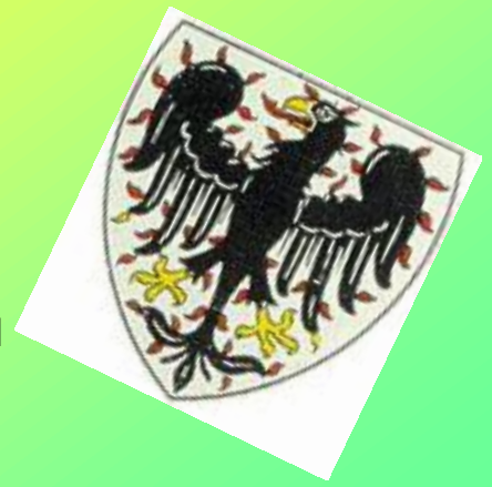
knížecí erb Přemyslovců