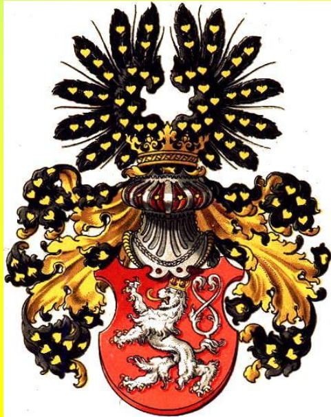
historický znak Čech