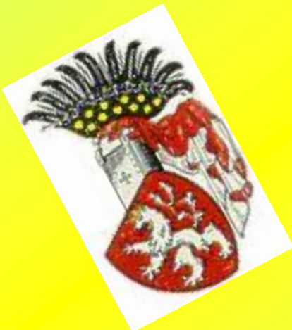
erb českých králů