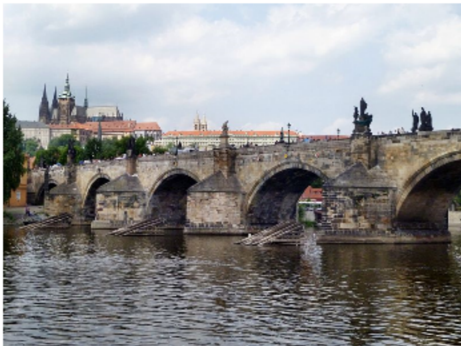
Karlův most a Pražský hrad