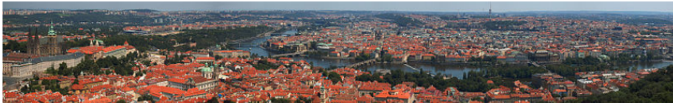
Praha krajské město Středočeského kraje