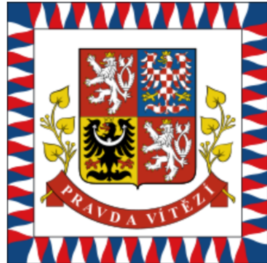
Vlajka prezidenta ČR