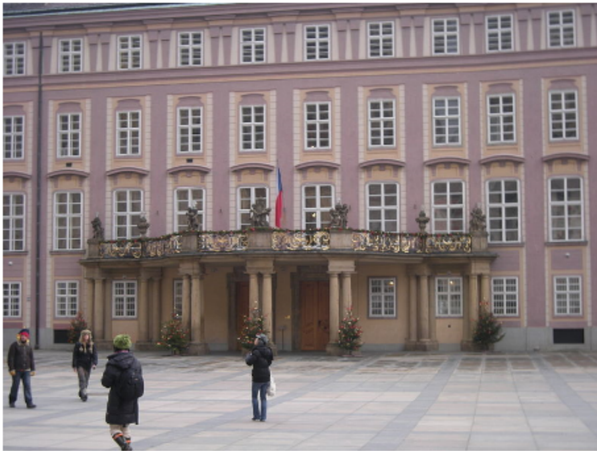
Prezidentský balkon na III. nádvoří