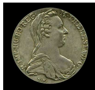
Tolar Marie Terezie