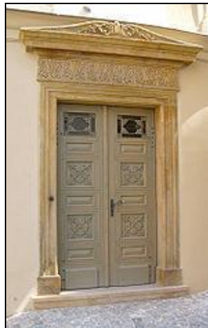
b) klasicismus (Č)