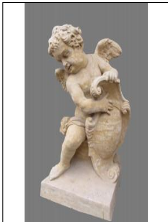
a) baroko (A)