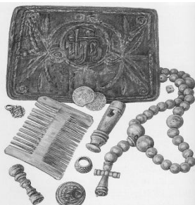
Osobní majetek námořníka z vraku lodě Jindřicha VIII. Mary Rose zahrnoval křesadlo, píšťalku, růženec a hřebec.