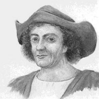
Kryštof Kolumbus (1451–1506) vyplul poprvé na moře ve 14 letech. Jeho loď ztroskotala na portugalském pobřeží.

Mnoho lidí tehdy věřilo, že je země značně menší než ve skutečnosti. Když Kolumbus přes Atlantický oceán doplnul ke skupině ostrovů, nazval je Západní Indie. Ve skutečnosti šlo o ostrovy v Karibském moři. Kolumbus cestoval do Ameriky ještě třikrát, ale není známo, zda věděl, že jde o Ameriku, nikoliv o Asii.