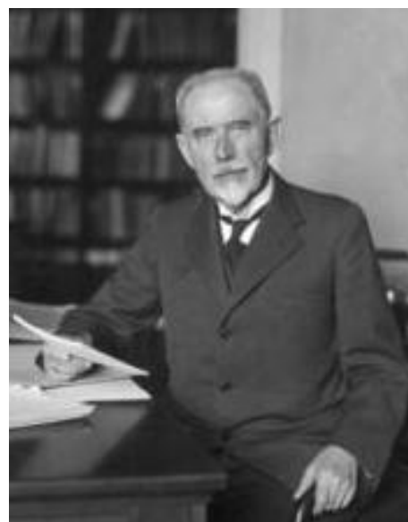
Sorensen, S. P. L., Dánsko 1