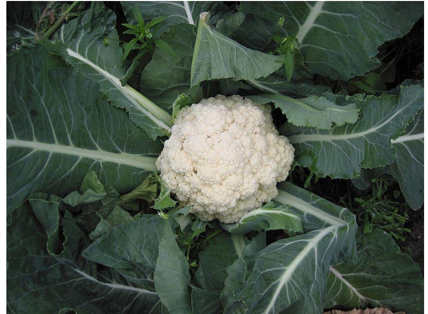
Obr. 8 KVĚTÁK