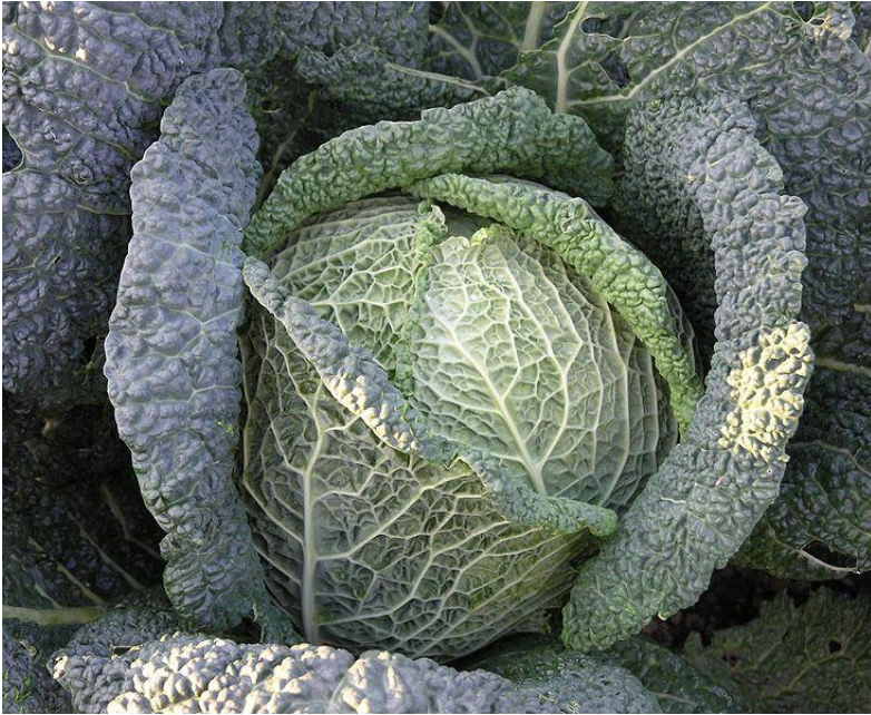
Obr. 7 KAPUSTA