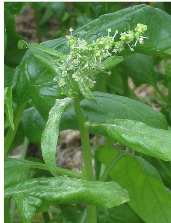
Obr. 10 ŠPENÁT