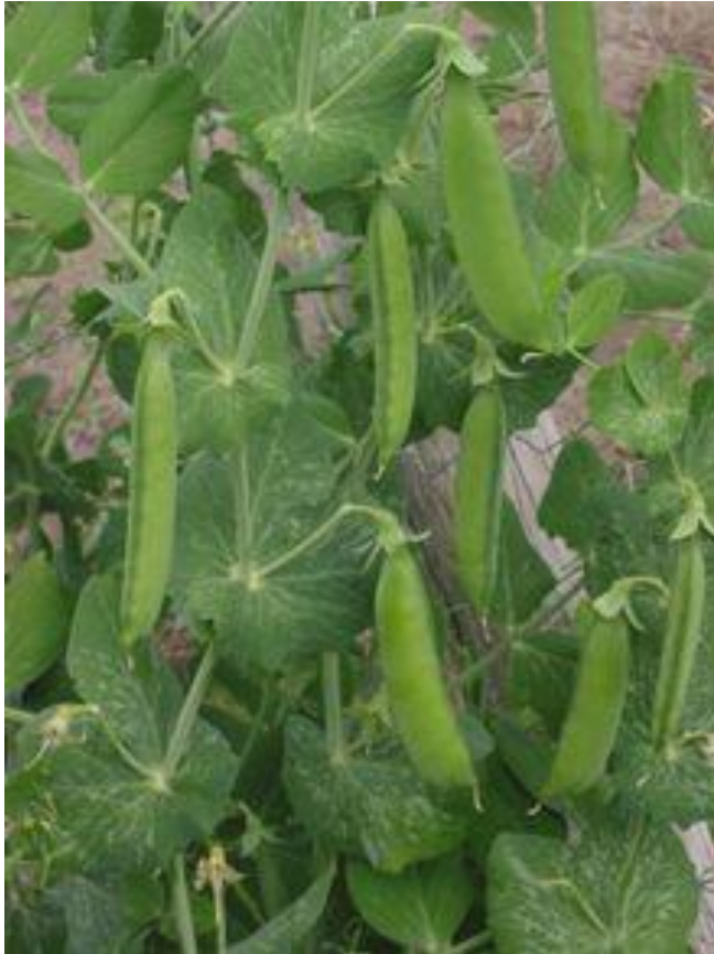
Obr. 11 HRÁCH