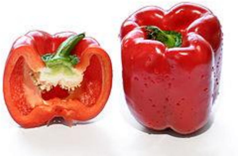
Obr. 13 PAPRIKA