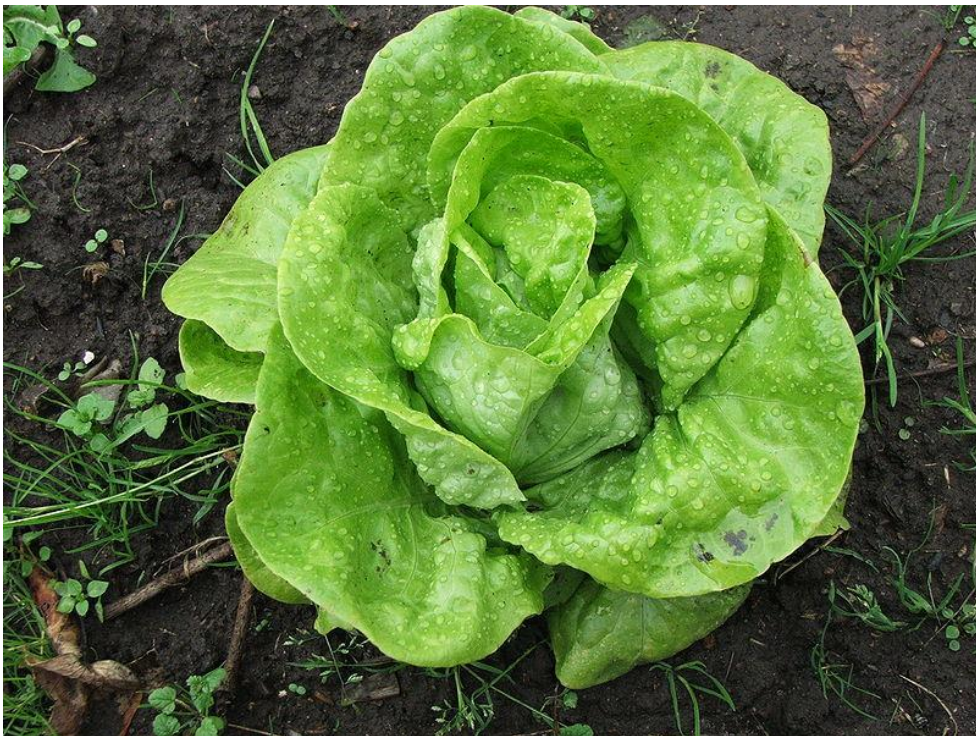
Obr. 9 HLÁVKOVÝ SALÁT