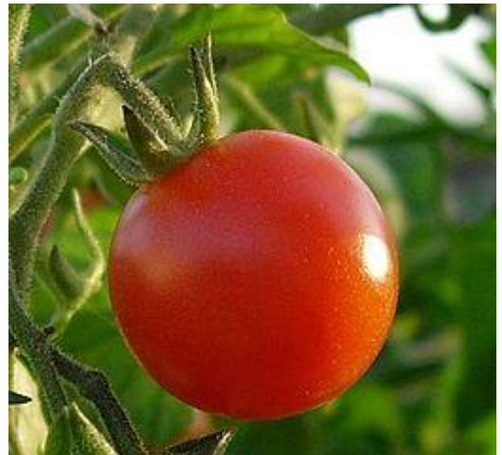
Obr. 14 RAJČE